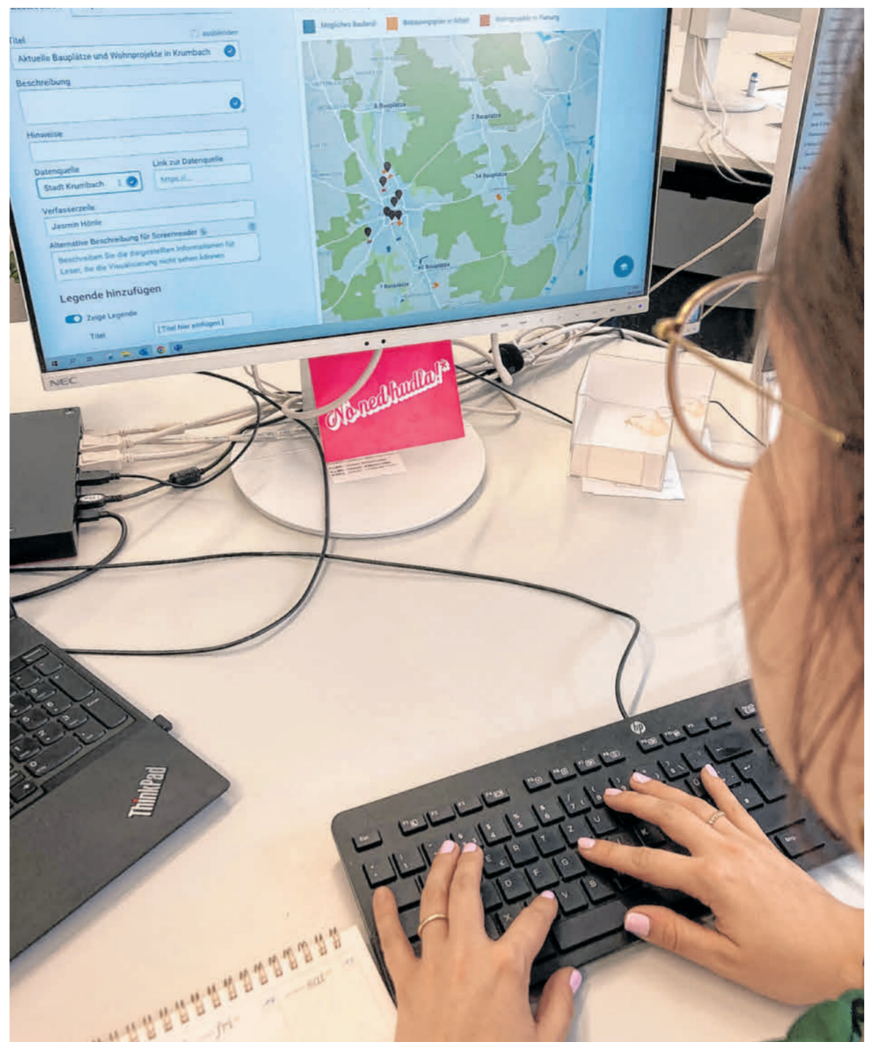
Je nach Thema können in einem Online-Artikel auch digitale Grafiken oder andere Elemente verwendet und eingebaut werden.

Die endgültige Version des Textes erscheint dann in der Abendausgabe und natürlich der Print-Zeitung. Oft sind die Geschehnisse vom Vortag jedoch schon abgeschlossen, wenn Sie Ihre Zeitung im Briefkasten finden. Als Online-Leser und Leserin können sie die Neuigkeiten bereits am selben Tag mitverfolgen.