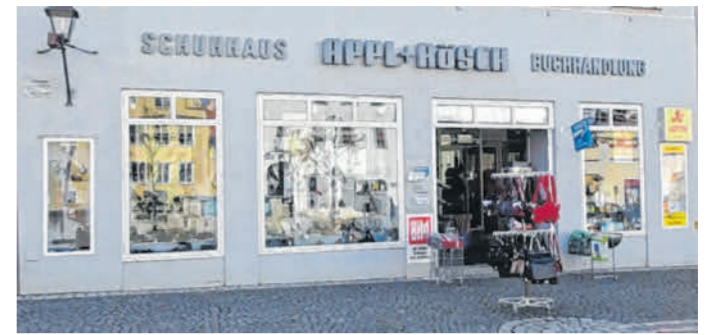
Servicepartner Appl & Rösch in Wemding.

Sie leisten Leserservice, verkaufen Tickets, nehmen Kleinanzeigen auf und verkaufen die Heimatprodukte der Augsburgers Allgemeinen Zeitung: Die Servicepartner der Donauwörther Zeitung. Diese sind das Buchhaus Greno in der Donauwörther Reichsstraße, Deibl Kreativ (kein Ticketservice) in Rain und das Schuhhaus-Schreibwaren Appl & Rösch (kein Ticketservice) in Wemding. Weitere Infos zu den Servicepartnern gibt es im Internet unter https://www.augsburger-allgemeine.de/servicepartner/service-partner/