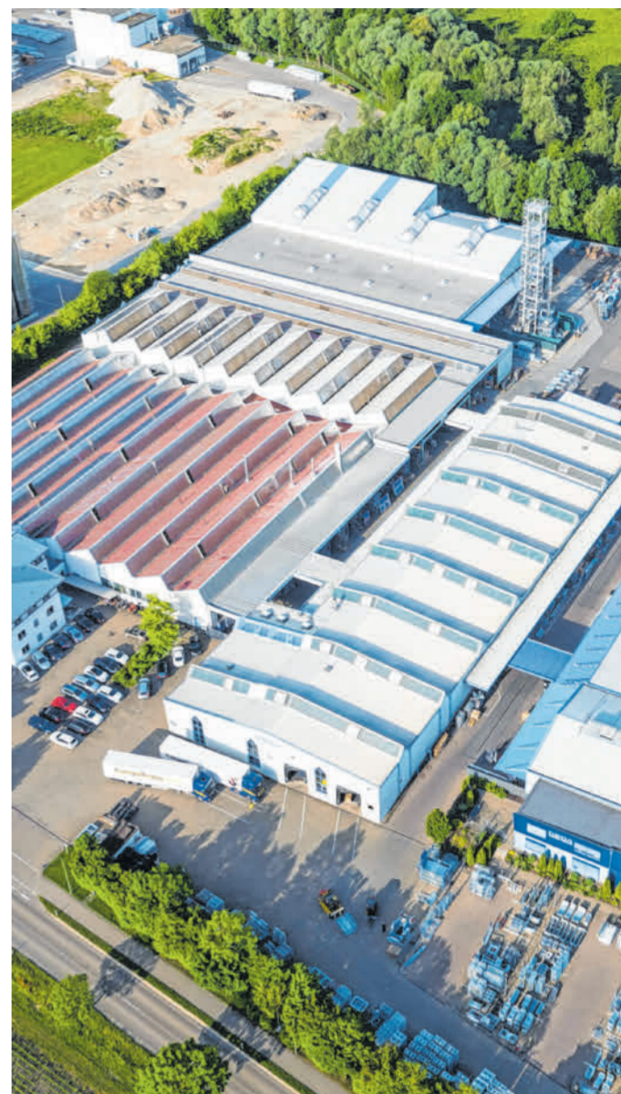
Ein Global Player ist die Firma Grenzebach in Bäumenheim, die derzeit wieder kräftig investiert.