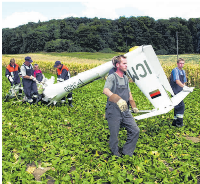
Die Reste eines tragischen Unglücks: Bei Lechsend starben 2003 sechs Menschen durch eine Kollision zweier Flugzeuge.