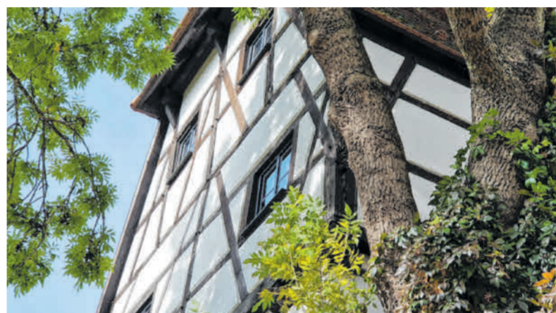
Donauwörth ist eine Perle mit liebenswert schönen Ecken wie hier am Färbertörl.