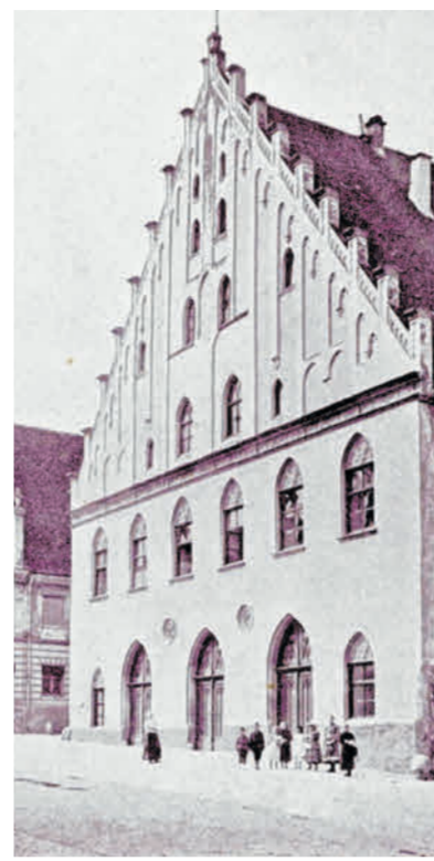
Das Gebäude im Herzen Donauwörths hat eine lange Tradition.