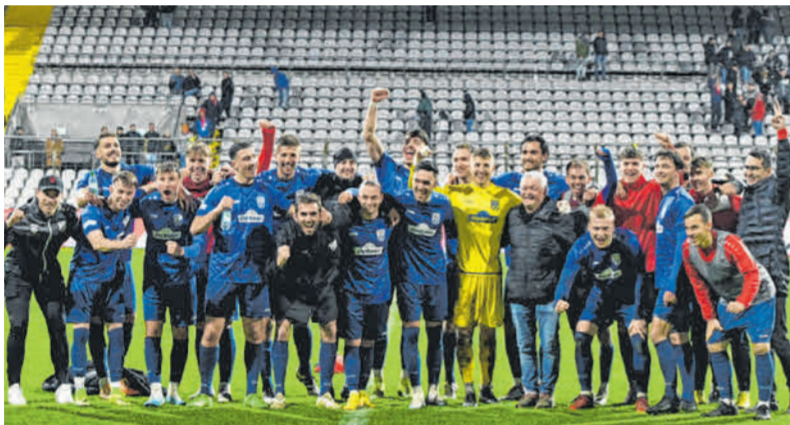
Die Fußballer des TSV Rain bejubelten im Frühjahr zwar einen Sieg beim FC Bayern München II (Bild), stiegen aber trotzdem aus der Regionalliga ab. Nun startet der ranghöchste Landkreis-Verein in der Bayernliga.