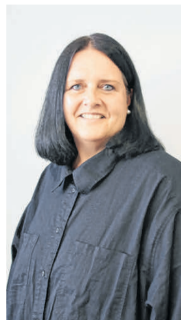
Claudia Bürger Mediaservice