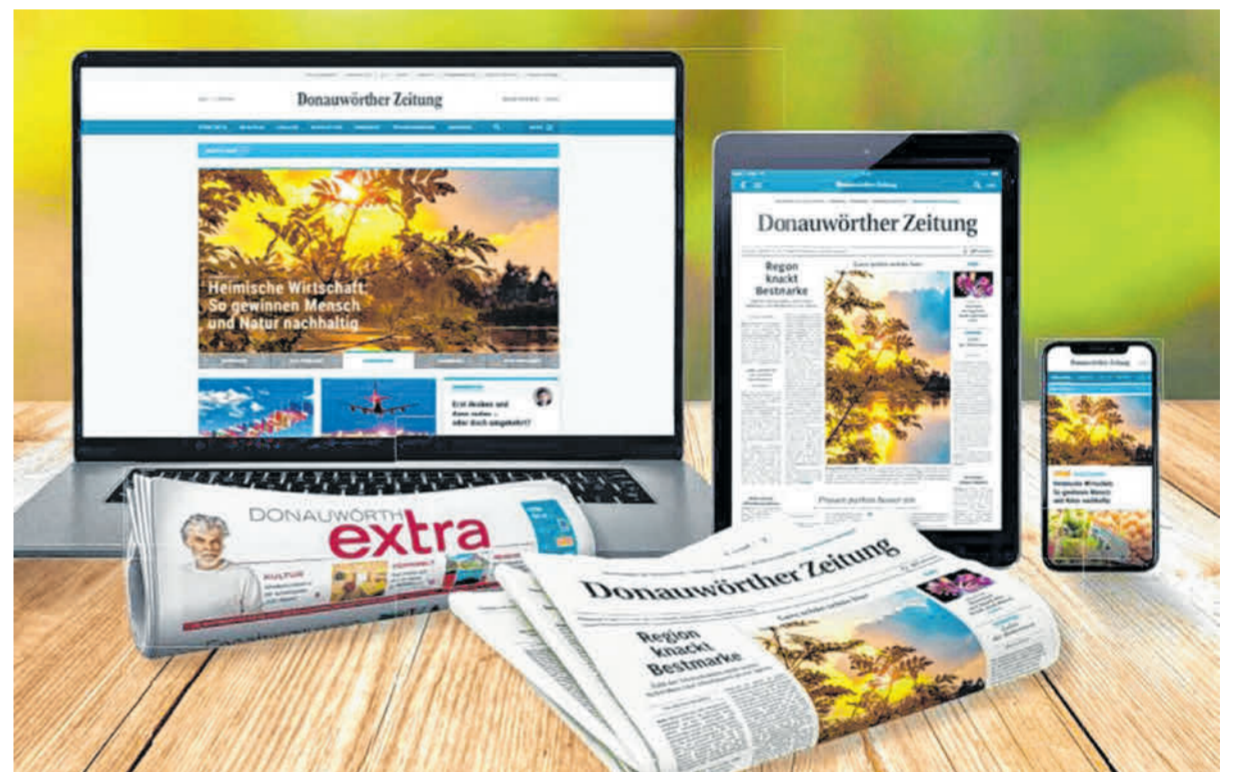
Mit der Donauwörther Zeitung erreichen Inserenten punktgenau die gewünschte Zielgruppe.