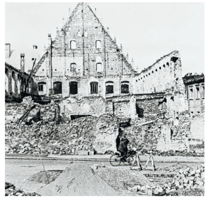
Ein Bild aus den schlimmsten Tagen, als nach dem Bombenangriff auf Donauwörth das Tanzhaus fast vollständig zerstört wurde.