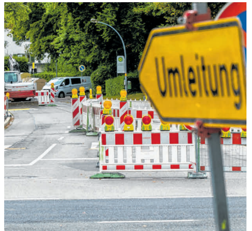
Aktuelle Themen, welche die Menschen in der Region bewegen – diese werden von Lokaljournalisten genauer beleuchtet.

weiß, dass er nicht im Elfenbeinturm arbeiten kann. Leserinnen und Leser sind nicht irgendwo weit fort, sondern man begegnet ihnen beim Einkaufen im Supermarkt oder am Wochenende auf dem Sportplatz. Ebenso ist es ein Unterschied, ob man von der Redaktion aus die Bundesregierung kritisiert oder den Bürgermeister im Nachbarort. Für die Lokalredaktionen sind die kurzen Wege nicht nur Alltag, sondern auch eine Voraussetzung für die tägliche Arbeit. So manches Thema hätte es ohne einen Leseranruf oder eine E-Mail nicht gegeben. Und auch die klassischen Leserbriefe sind oft nicht nur Reaktion auf eine Berichterstattung, sondern Ausgangspunkt für eine Recherche. Deshalb gibt es bei aller Veränderung auch Beständiges: So sehr sich der Lokaljournalismus auch gewandelt hat, die Menschen in der Region sind und bleiben auch nach 75 Jahren das wichtigste Thema für die Lokaljournalisten. az