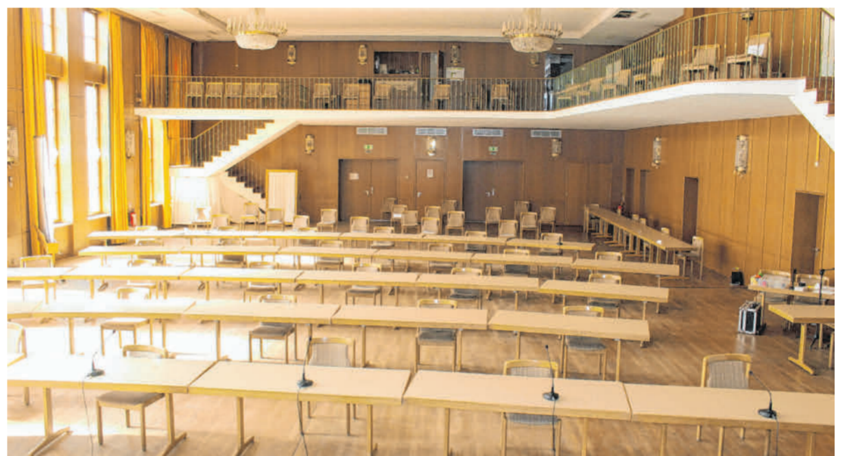
Während der Corona-Pandemie diente der Tanzhaus-Saal dem Stadtrat als Sitzungsstätte.