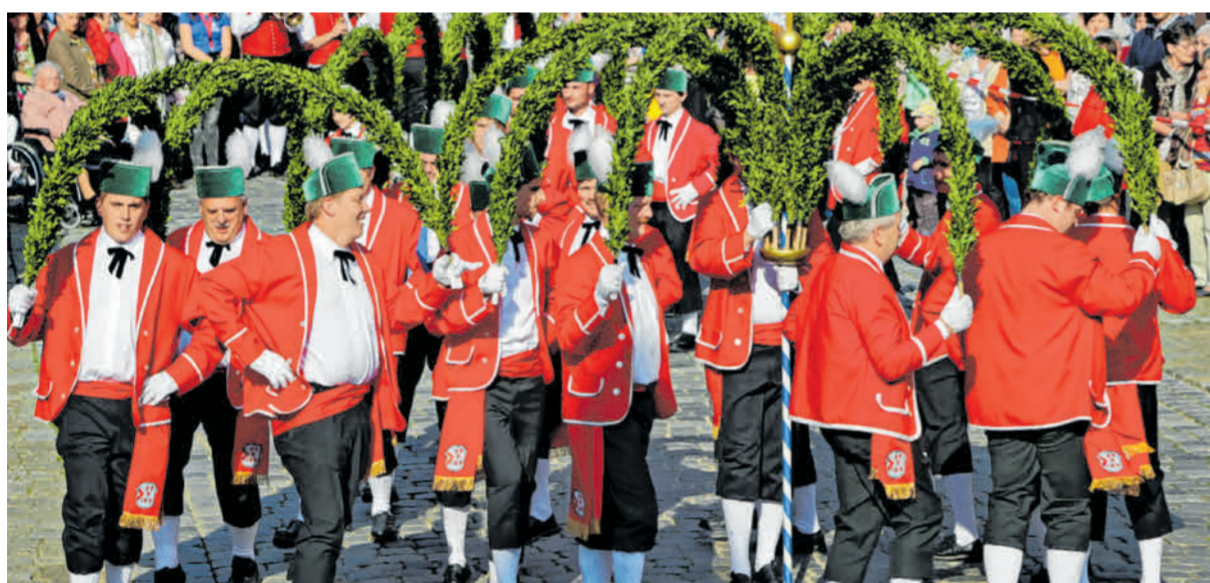
Auch in Wemding wird gerne und oft gefeiert. Eine Attraktion war etwa in diesem Jahr der Schafflertanz, der eine langjährige Geschichte in der Stadt hat.