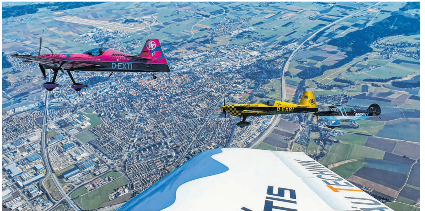
Die Segelflugsportgruppe (SFG) Donauwörth-Monheim ist in der Bundesliga im Einsatz und sorgt dabei immer wieder für spektakuläre Motive und Fotoaufnahmen.

geht es bei den Schützenvereinen nicht nur um das sportliche Kräftemessen, sondern auch das gelebte Brauchtum. Klassische Hallensportarten wie Basketball, Handball oder Volleyball werden im Gebiet der Donauwörther Zeitung ebenfalls – und zum Teil höherklassig – ausgeübt. Die Turner des TSV Monheim haben auch schon in der Bundesliga für Aufsehen gesorgt und stehen gerade in der Jugend für ein großes Breitensport-Angebot. Auch für Randsportarten wie Floorball oder Segelfliegen sowie das in hiesigen Gefilden eher seltene Eishockey finden sich bei uns begeisterte Sportler, über die natürlich auch regelmäßig berichtet wird.