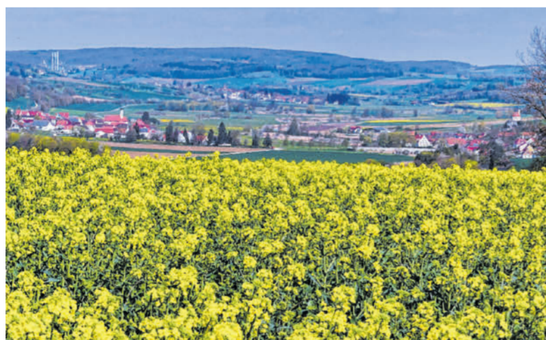
Das Rapsfeld leuchtet gelb am Maggenberg nahe der Großen Kreisstadt Donauwörth.