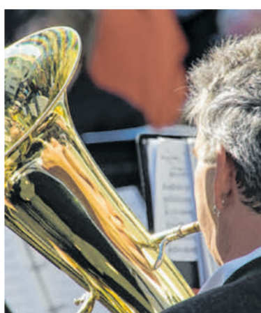
Die Musik spielt immer eine wichtige Rolle.