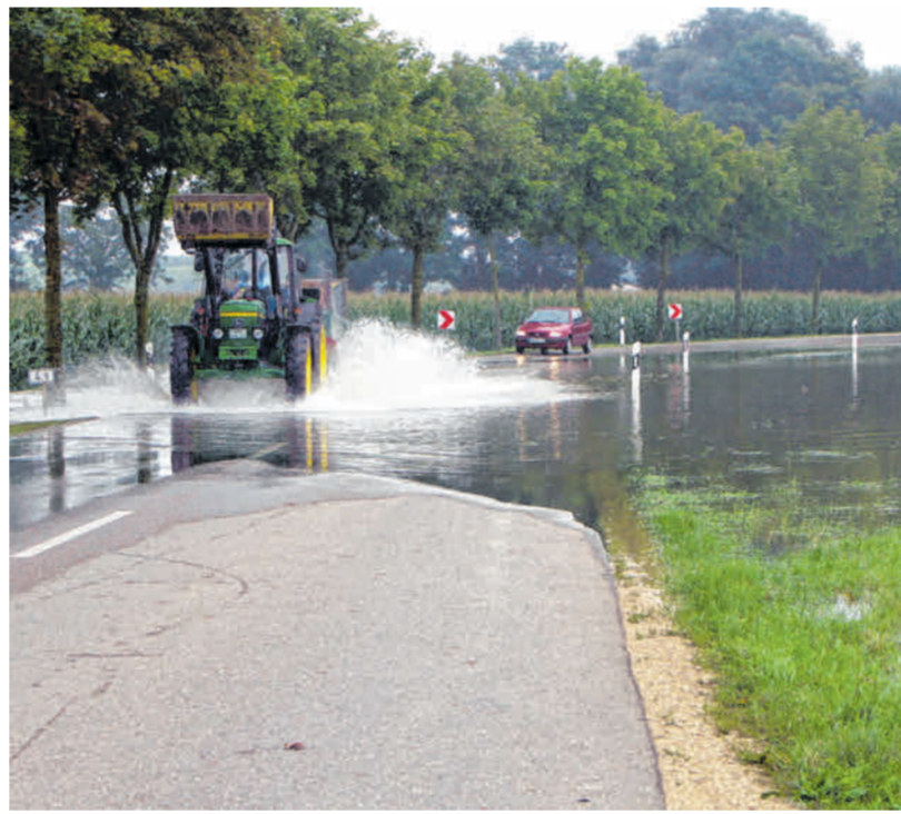
Von Flüssen und Gewässern geprägt, kommt es in der Region immer wieder zu Hochwasser. Zumeist gehen diese Ereignisse glimpflich aus.