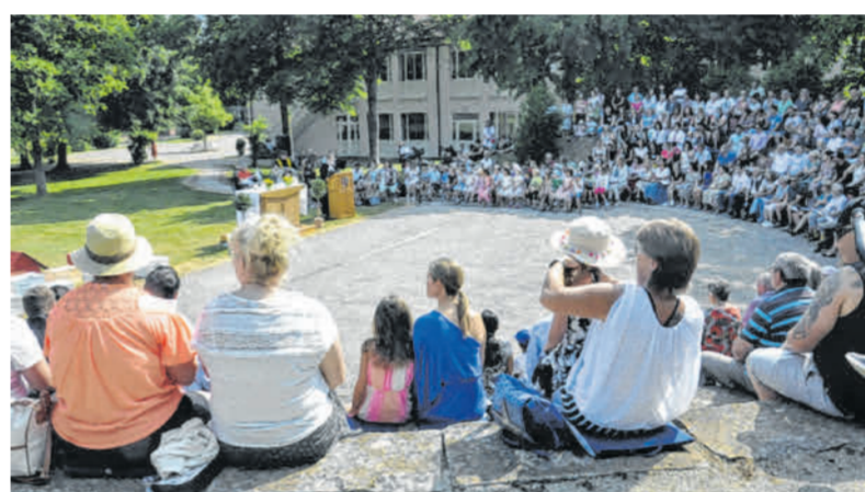
Auch an den Schulen in der Region wird die Kultur mit Festen gepflegt, wie hier in Mertingen.