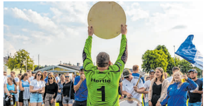
In jedem Frühjahr begleitet die Donauwörther Zeitung die Fußball-Aufsteiger in der Region – so wie diesmal den TSV Ebermergen, der nach erfolgreicher Relegation jubeln durfte.