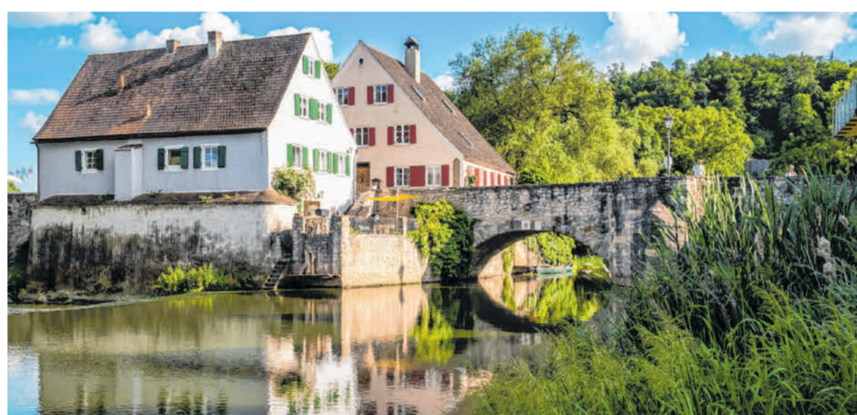
Ein Blickfang ist die Steinerne Brücke in Harburg. Harburg liegt zwischen den beiden großen Städten Donauwörth und Nördlingen und weiß zu begeistern.