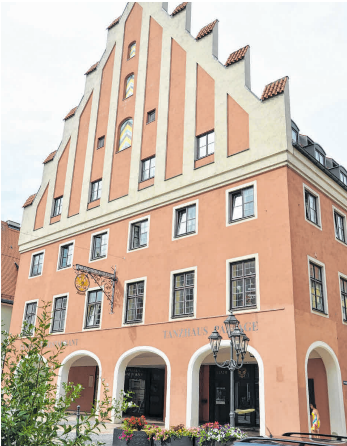
Das Streitthema Nummer 1 in Donauwörth. Was passiert mit dem Tanzhaus.