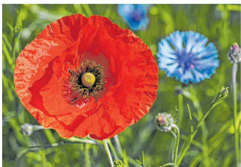
Auch ein tolles Motiv: Dieser Klatschmohn am Wegesrand, besonders bei Wanderungen zu sehen.