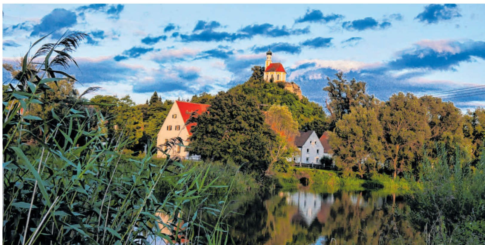
Fast zu schön um wahr zu sein: Die Würnitzsteinkapelle auf dem Kalvarienberg. Wie hier in Würnitzstein lassen sich überall schöne, manchmal verborgene Schönheiten entdecken.

Immer wieder finden schöne Aufnahmen den Weg in unsere Redaktion. Wir veröffentlichen die Fotos gerne, damit sich unsere Leserinnen und Leser daran freuen können – verbunden mit dem Dank an alle unseren Leserfotografen und Freien Mitarbeiter und mit der Aufforderung: Machen Sie weiter so!