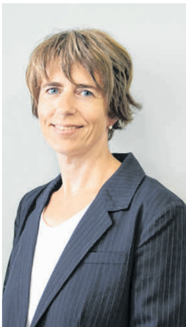
Birgit Scherer Mediaservice