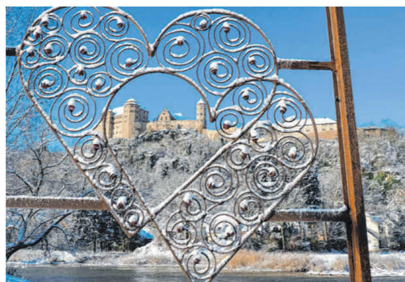
Eine kreative Perspektive auf das Schloss Harburg im Winter. Die Städte und Landschaften haben immer ihren Reiz.