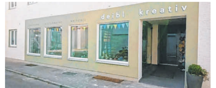
Servicepartner Deibl Kreativ in Rain.