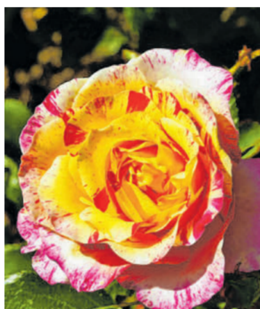
Rosen sind ein beliebtes Motiv unserer Fotografen.