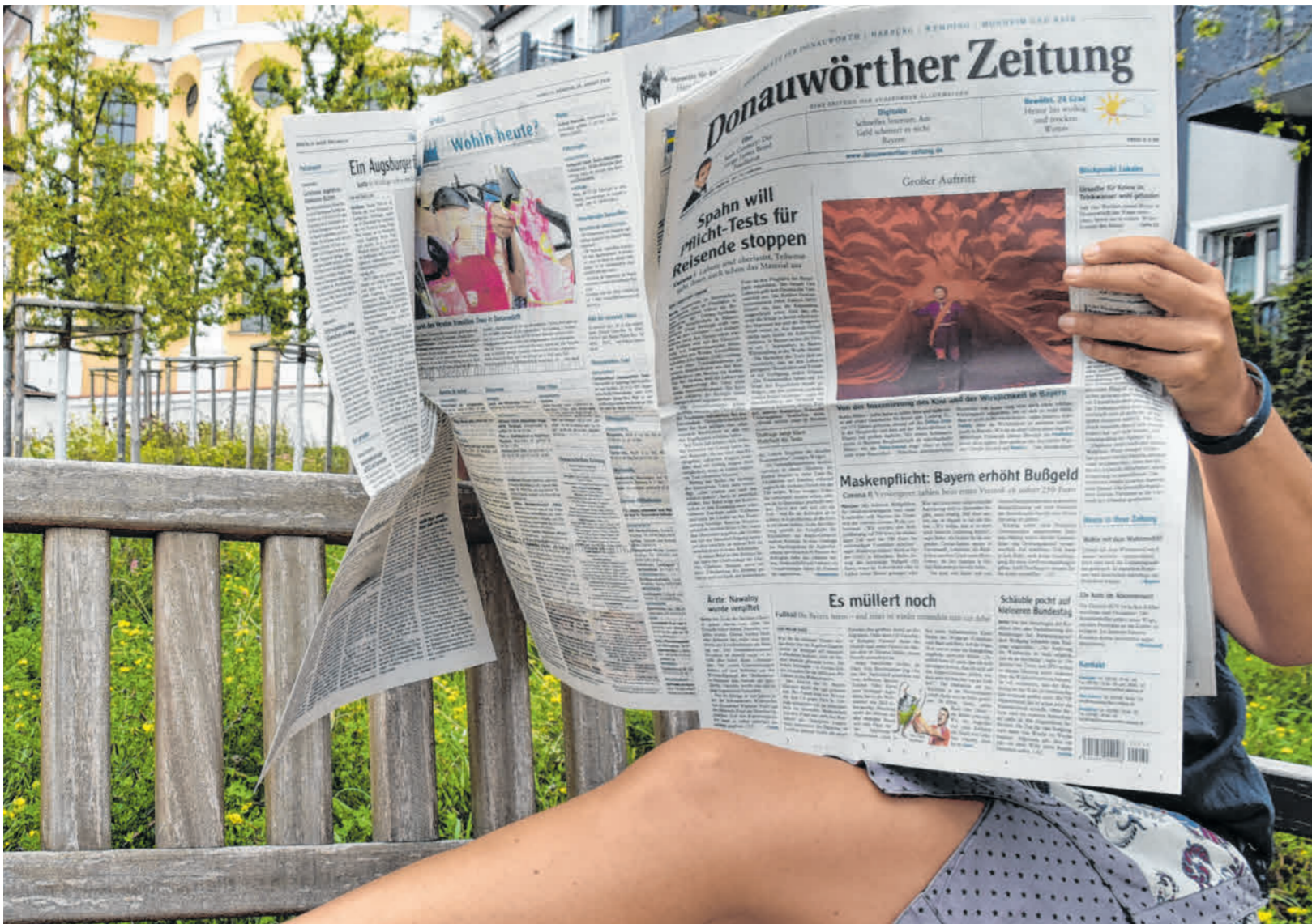
Was bedeutet guter Lokaljournalismus? Diese Frage beschäftigt auch die Redaktion der Donauwörther Zeitung seit mittlerweile 75 Jahren und wird auch in Zukunft wichtig sein.