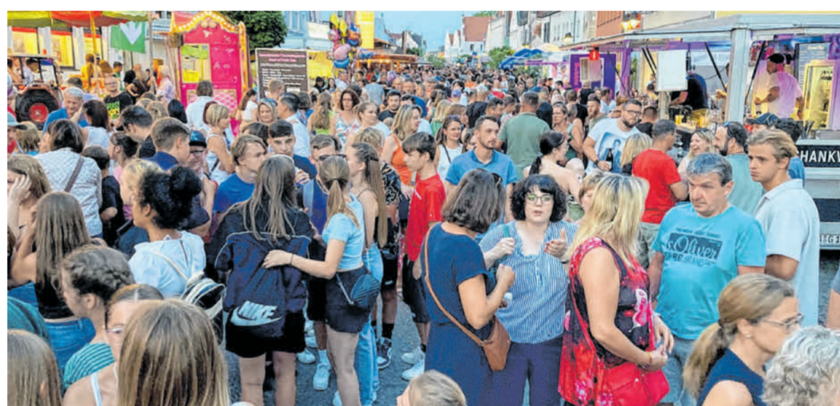
Zusammenkommen, Gemeinsamkeit erleben – wie hier beim Stadtfest in Rain, das suchen die Menschen nach den Zwangspausen in Corona-Zeiten.

Die Stadt Rain gratuliert der Donauwörther Zeitung zum 75-jährigen Jubiläum!