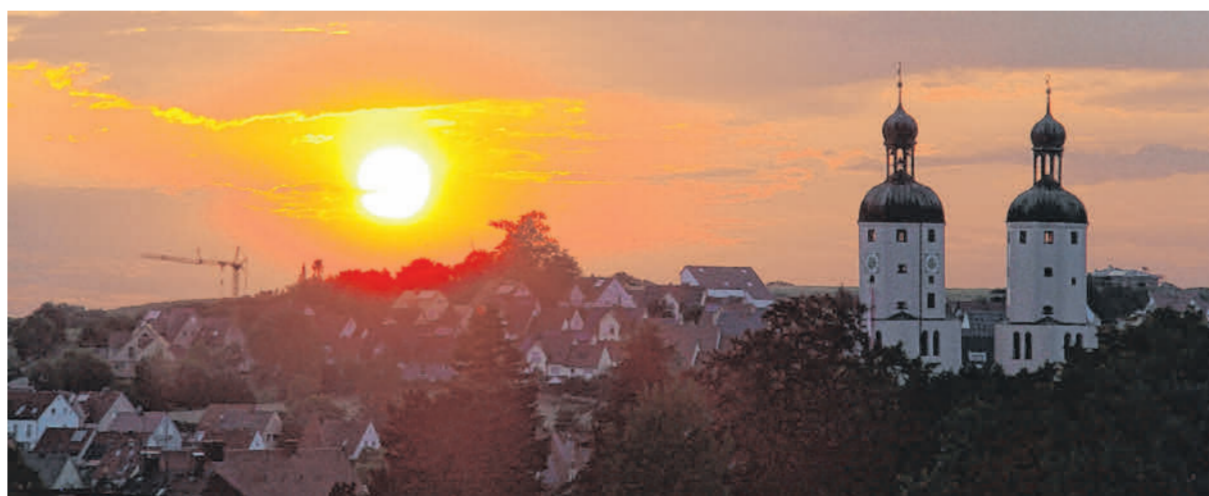
Sonnenuntergang über Wemding. Markant recken die Türme der Stadtpfarrkirche Sankt Emmeram ihre Zwiebelhauben in den Abendhimmel.