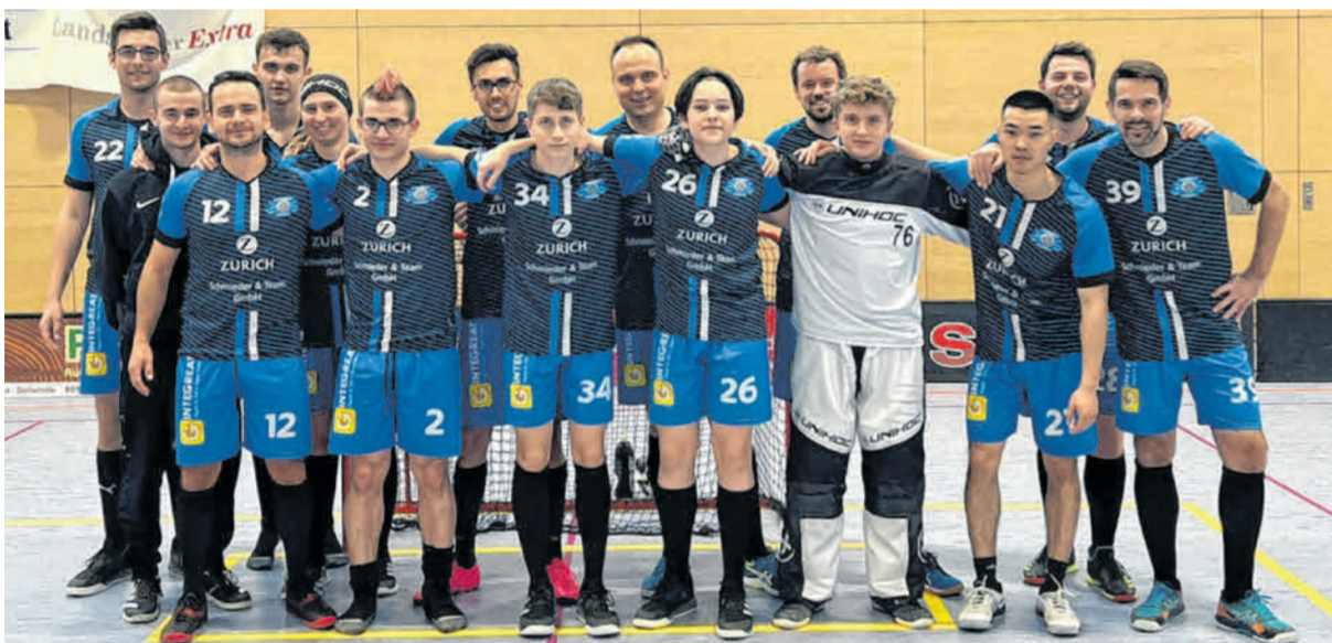
Die SG Augsburg/Nordheim durfte sich im Frühling über die süddeutsche Meisterschaft im Floorball freuen. Besonders schön: Das Finale fand in der heimischen Neudegger Halle in Donauwörth statt.