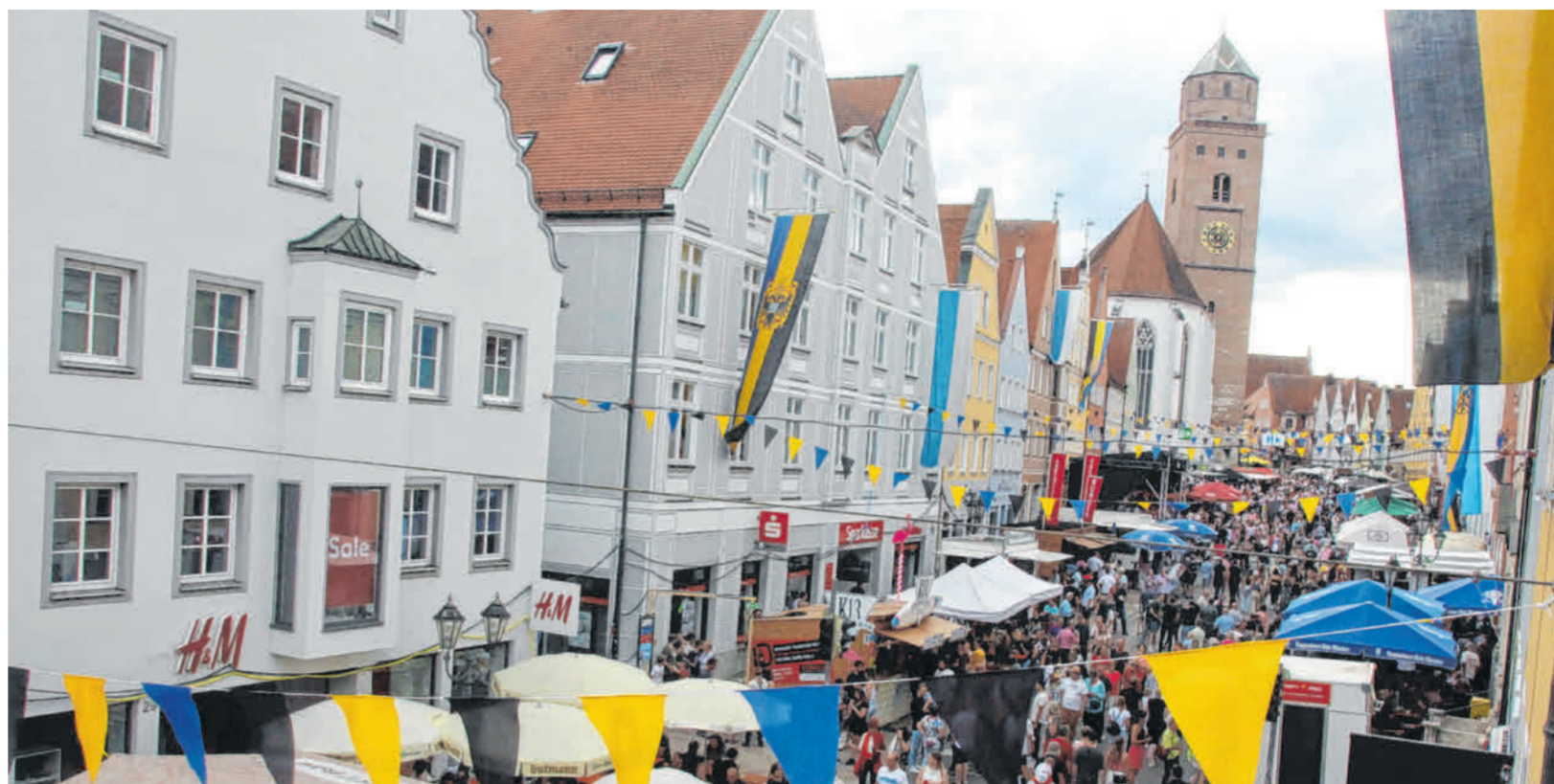
Nach vier Jahren Pause feierte die Große Kreisstadt wieder ihr Reichsstraßenfest. Zehntausende Gäste kamen an vier Tagen in die Altstadt – ein grandioses Fest für jung und alt.

Die Heimatzeitung hat diese Fest in all den Jahren begleitet. Das war auch in diesem Jahr so. Es geht den Redakteurinnen und Redakteuren auch letztlich darum, ein Stück Heimat zu dokumentieren, für das jetzt, aber auch die Historie festzuhalten.