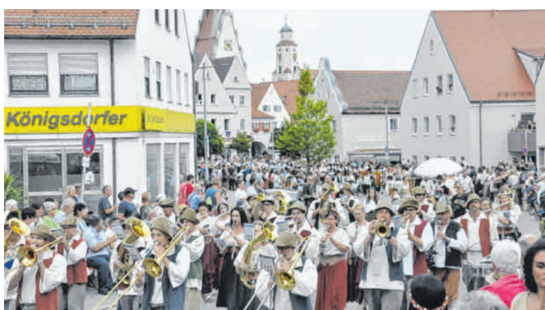
Ein Spektakel der ganz besonderen Art: das Historische Stadtfest in Monheim mit einem fulminanten Umzug.