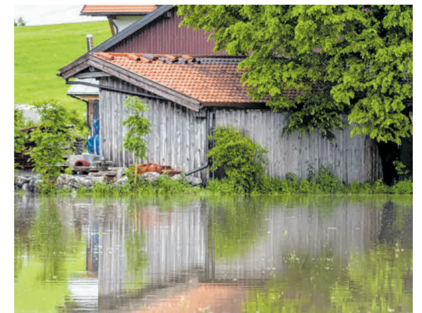
Ob Verkehrsunfall oder Hochwasser – die DWZ-Redaktion ist immer nah am Geschehen dran.