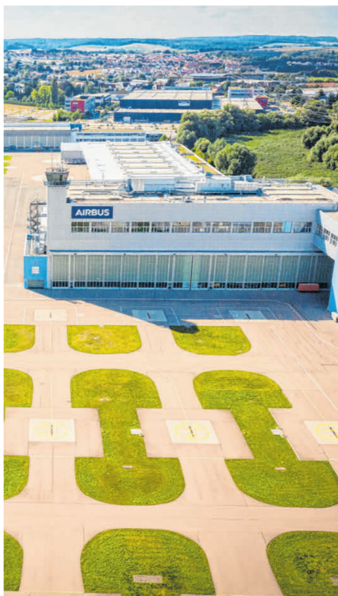
Airbus Helicopters ist nach wie vor der größte Arbeitgeber der Region.