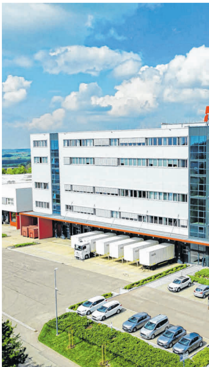
Die Firma Hama feierte heuer ihr 100-jähriges Bestehen mit einem „Tag der offenen Tür“.