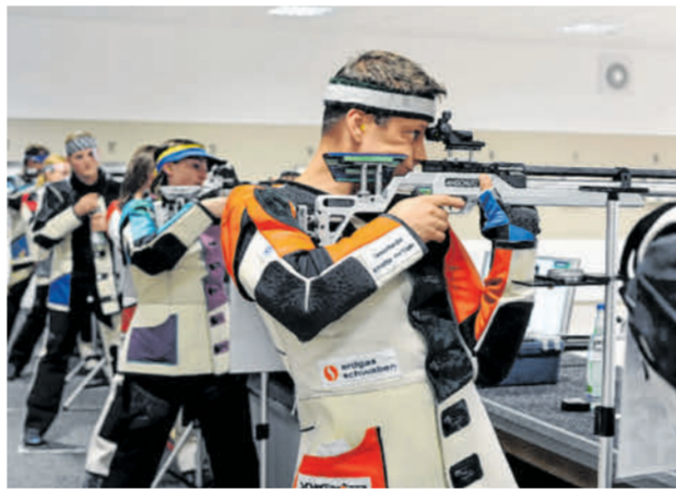
Der Schießsport erfreut sich in zahlreichen Vereinen im Landkreis großer Beliebtheit.