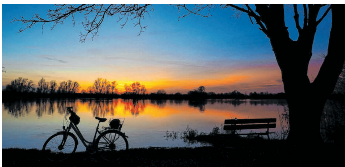
Ein Ort zum inne Halten. Diesen traumhaften Sonnenuntergang am Baggersee Hamlar hat unsere Leserfotografin Sylvie Kunz eingefangen.