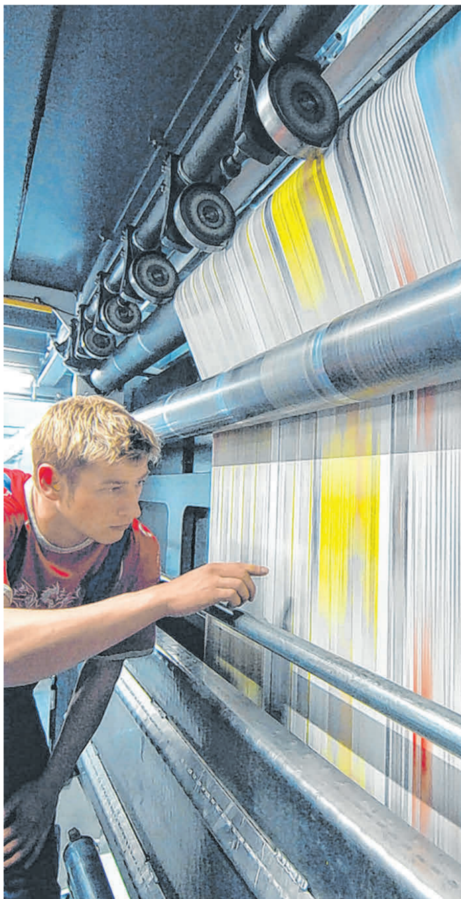
Höchste Qualität steht Tag für Tag beim Druck der Donauwörther Zeitung an oberster Stelle.