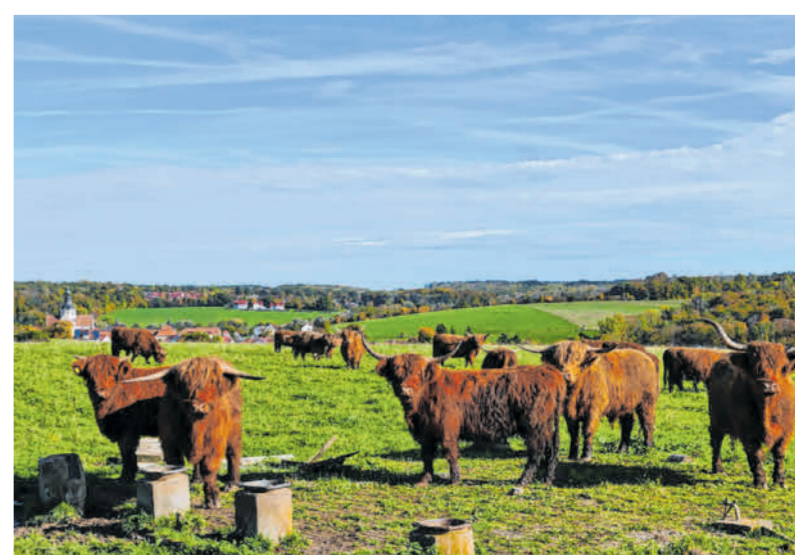
Diese schottischen Hochlandrinder auf der Weide bei Kaisheim sorgen für die Landschaftspflege.