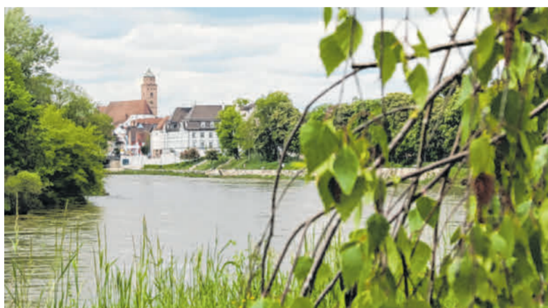
Die Große Kreisstadt Donauwörth mit ihrem Markenzeichen: den Flüssen Donau und Würnitz.