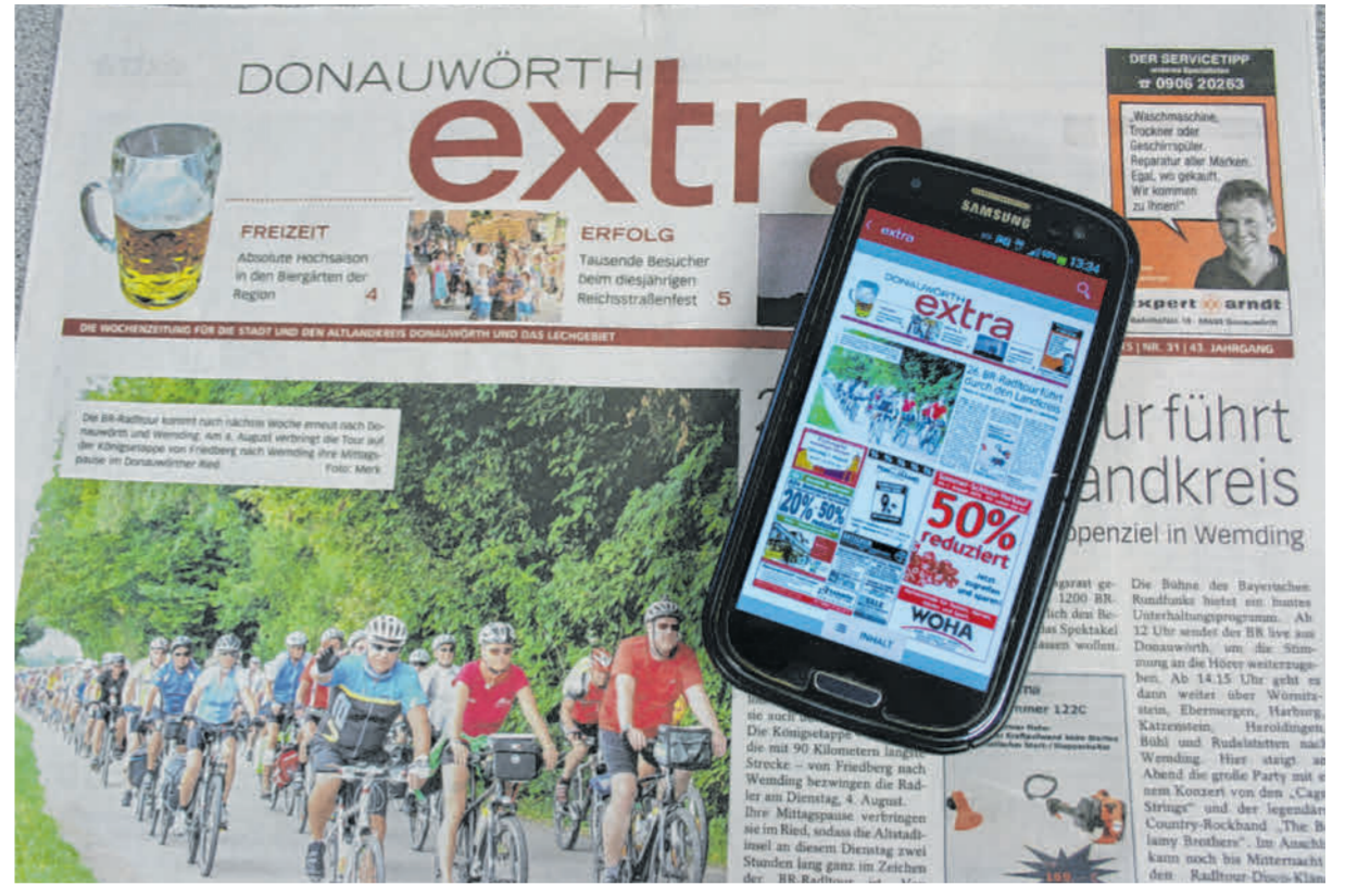
Das Donauwörth extra gibt es Online oder am Samstag in Ihrem Briefkasten.